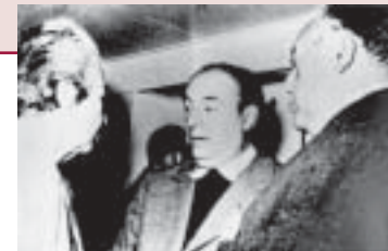
Con Gabriela Mistral y Miguel Ángel Asturias (Premio Nobel 1967).