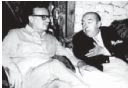
Con el Presidente Allende

El poeta ha sido la figura central de las Ferias del Libro de Calcuta, Casablanca, Bruselas, Guadalajara, Santo Domingo, Bogotá, La Habana, Buenos Aires, y del homenaje a Chile y su literatura que realizó el Salón Internacional del Libro y de la Prensa de Ginebra, a fines de abril.